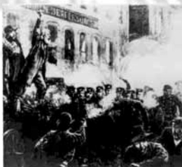
Comício de 1º de Maio de 1886, realizado em Chicago, Estados Unidos